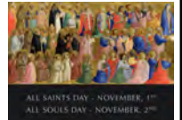
ALL SAINTS DAY - NOVEMBER 1 st ALL SOULS DAY - NOVEMBER 2 nd

*El sábado 2 de noviembre, el Padre Jacob seguirá celebrando la Misa en inglés a las 4:30pm y las confesiones se escucharán en los horarios habituales de las 3:45pm y las 6:45pm.